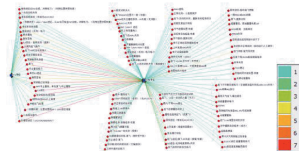
图 2 培训科目网络热图

采用颜色标记课程出现的次数, 由蓝色过渡至红色, 分别表示课程出现的频率由低至高, 从图 2 的社会网络可视化结果中可以看出: 经常出现的科目(连线为红色部分), 通常也在 STC 课程中出现, 因此本部分研究通过社会网络的社群图法建立假设: 转机型模拟机培训时间的影响要素之一为初始培训频率。